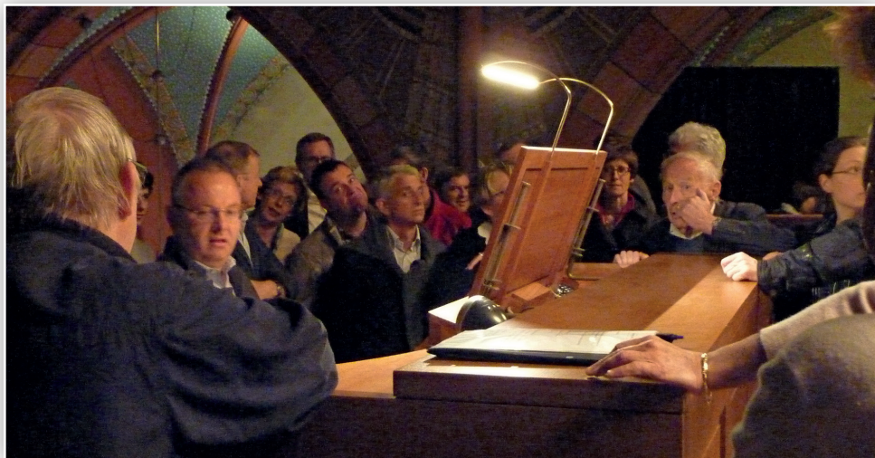
Le Prélude festif est traditionnellement clôturé par une visite de l'orgue. Tous les auditeurs sont invités à monter à la tribune d'orgue pour suivre une présentation de l'orgue et jeter un regard „derrière les coulisses“, c.-à-d. derrière les tuyaux du buffet d'orgue pour découvrir ce qui se cache derrière la façade de l'orgue. Cette initiative connaît à chaque fois un franc succès. (Photo de l'édition 2015)

C'est par cette double voie que l'orgue Stahlhuth-Jann continuera à sonner au service de la promotion des nouveaux talents et futurs organistes.