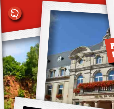
FÊTES ET MANIFESTATIONS