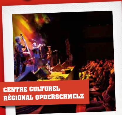
CENTRE CULTUREL RÉGIONAL OPDERSCHMELZ

CARLOS NÚÑEZ LEVELLERS DANCEPERADOS OF IRELAND BODH'AKTAN BALTIC SEA CHILD | SCHËPPE SIWEN BEOGA | LUXEMBOURG PIPE BAND