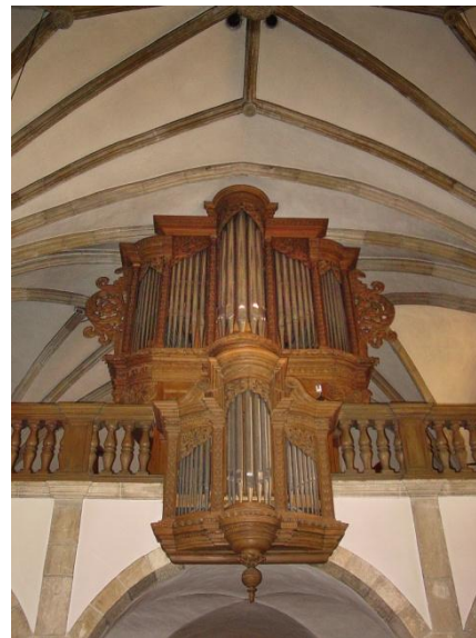
Luxembourg – St. Michaelskirche Westenfelder (1971; III/28) Stil (zur Wahl): Klassisch-französisch oder barock